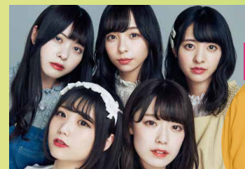
神宿 原宿発アイドルユニット