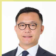
塚本堅一 元NHKアナウンサー